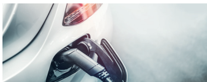
Elektrofahrzeuge als Dienstwagen: Neue Regelungen